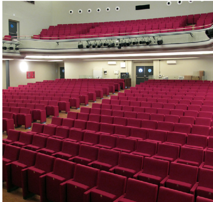
Teatro Góngora. Córdoba. SPAIN