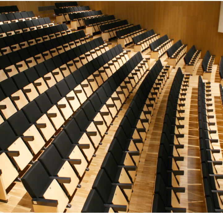
Teatro Salvador Tavora. Almonte. Huelva. SPAIN