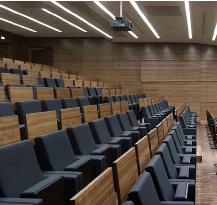
Deutsches Primatenzentrum GmbH – Leibniz Institut für Primatenforschung. Göttingen. GERMANY