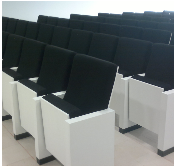
Escuelas Pías de Aragón. Zaragoza. SPAIN