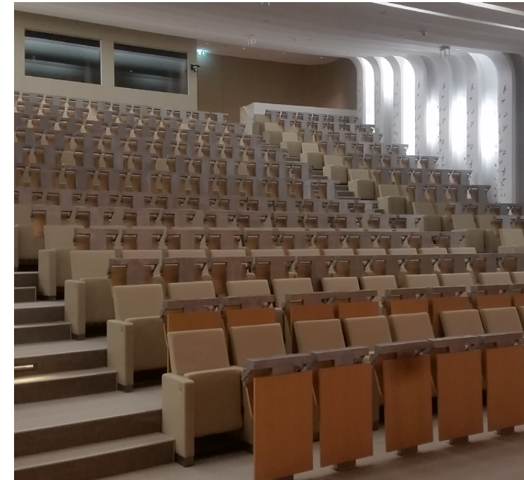
Qatar Faculty of Islamic Studies. Ar Rayyan. QATAR