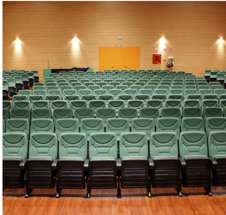
Auditorio de Tomares. Sevilla. SPAIN