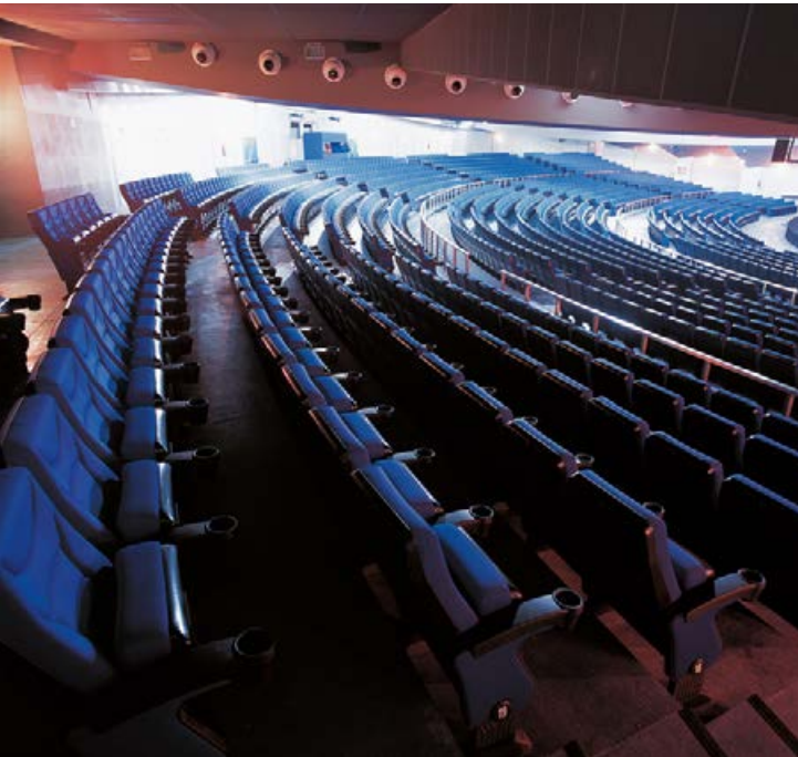
Parque de Atracciones de Madrid. SPAIN