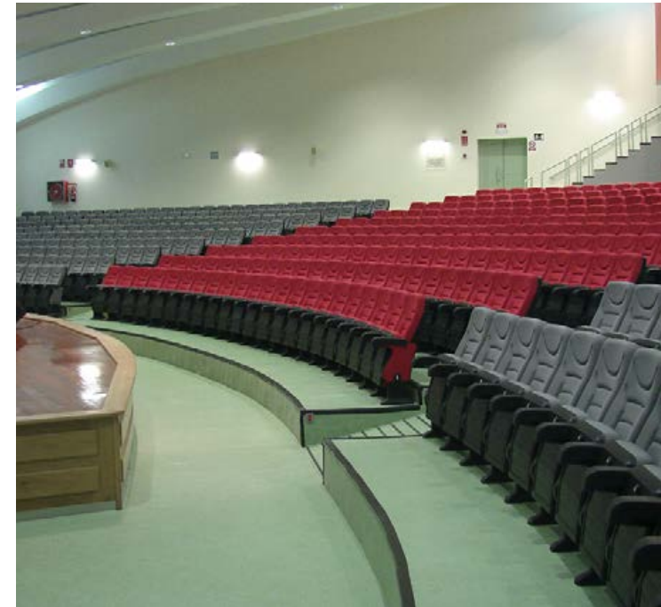
Auditorio Principe Felipe. Vigo. SPAIN